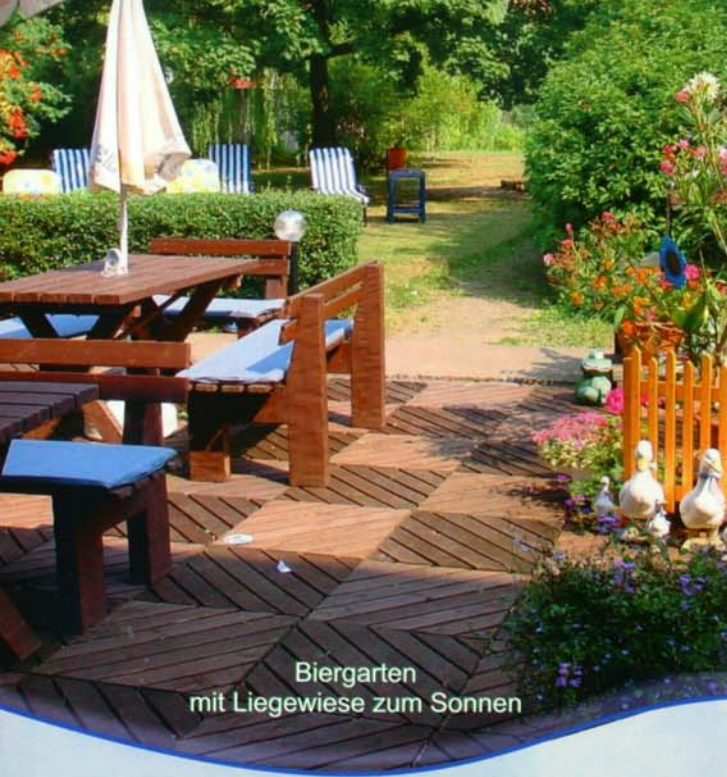
Biergarten mit Liegewiese zum Sonnen