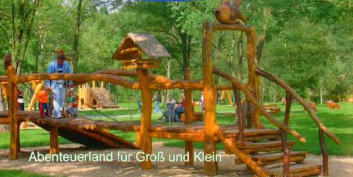
Abenteuerland für Groß und Klein