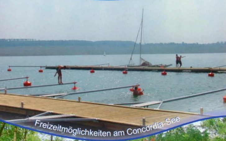
Freizeitmöglichkeiten am Concordia-See