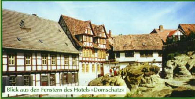
Blick aus den Fenstern des Hotels »Domschatz«

Aus den Fenstern des »Domschatz« schauen Sie auf die Klippen am Schlossberg. Ein Spaziergang könnte Sie daran entlang zum Klopstockhaus führen – über den legendären Finkenherd – und die Wassertorstraße wieder ums Schloss herum zu Ihrem Hotel »Domschatz«.