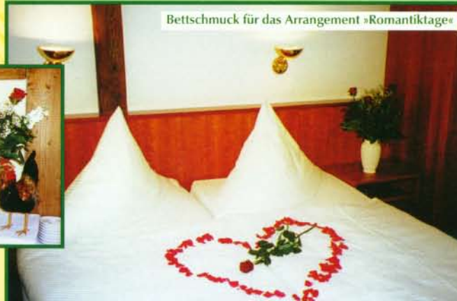
Bettschmuck für das Arrangement »Romantiktage«