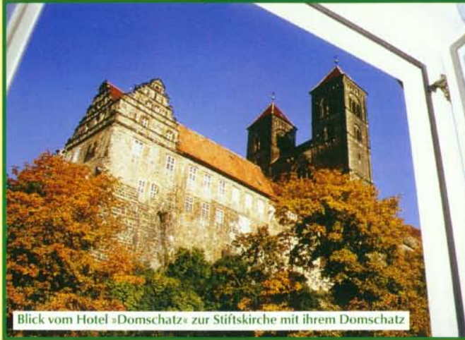
Blick vom Hotel »Domschatz« zur Stiftskirche mit ihrem Domschatz

Das Hotel Domschatz ist ein Kleinod unter den Fachwerkhäusern der Stadt Quedlinburg. Im Jahre 1993 entstand aus einem völlig verfallenen Fachwerkhaus das Hotel mit dem ganz eigenen Charme eines Schatzes. Das nach seiner Erbauung 1789 als Ausspanne und Handwerkerhof genutzte Gebäude gewinnt seinen Reiz als Hotel durch die geschichtliche Atmosphäre. Das Hotel »Domschatz« ent-