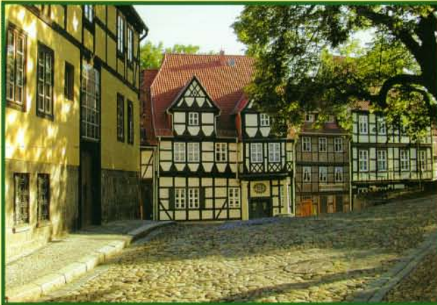
Blick aufs Klopstockhaus

Aus den Fenstern des »Domschatz« schauen Sie auf die Klippen am Schlossberg. Ein Spaziergang könnte Sie daran entlang zum Klopstockhaus führen – über den legendären Finkenherd – und die Wassertorstraße wieder ums Schloss herum zu Ihrem Hotel »Domschatz«.