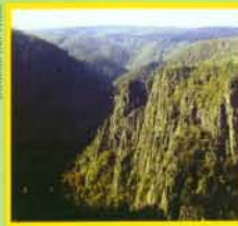
Hotel und die Aussicht

Unser Hotel ist ein günstiger Ausgangspunkt für die Erkundung der städtischen Sehenswürdigkeiten oder Ausflüge in die nähere Umgebung. Für nähere Auskünfte und für eine individuelle Planung steht Ihnen unser Team jederzeit zur Verfügung.