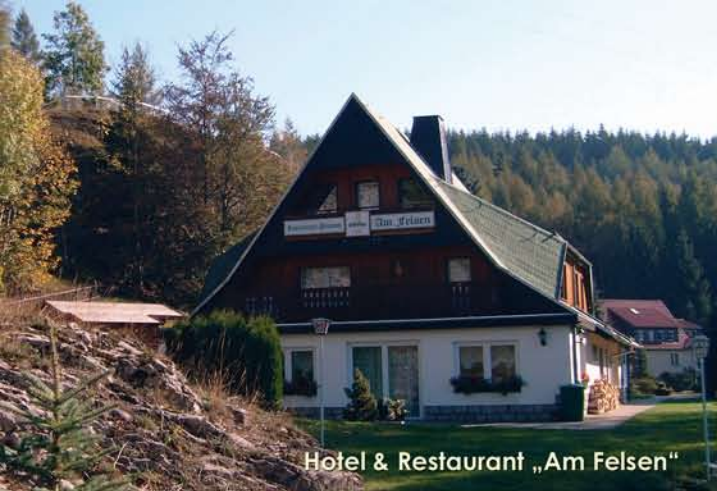
Hotel & Restaurant „Am Felsen“

Der markante Felsen, der unserer Pension seinen Namen gab, ist eines der vielen Highlights, von dem Sie Ihren Blick nicht mehr abschweifen lassen wollen, wenn Sie auf unserer Terasse sitzen oder von Ihrem Zimmerbalkon den Blick über die nahen Fichtenwälder und in den Harz richten.